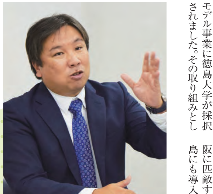
里崎 智也 徳島県鳴門市出身 元プロ野球選手、野球解説者